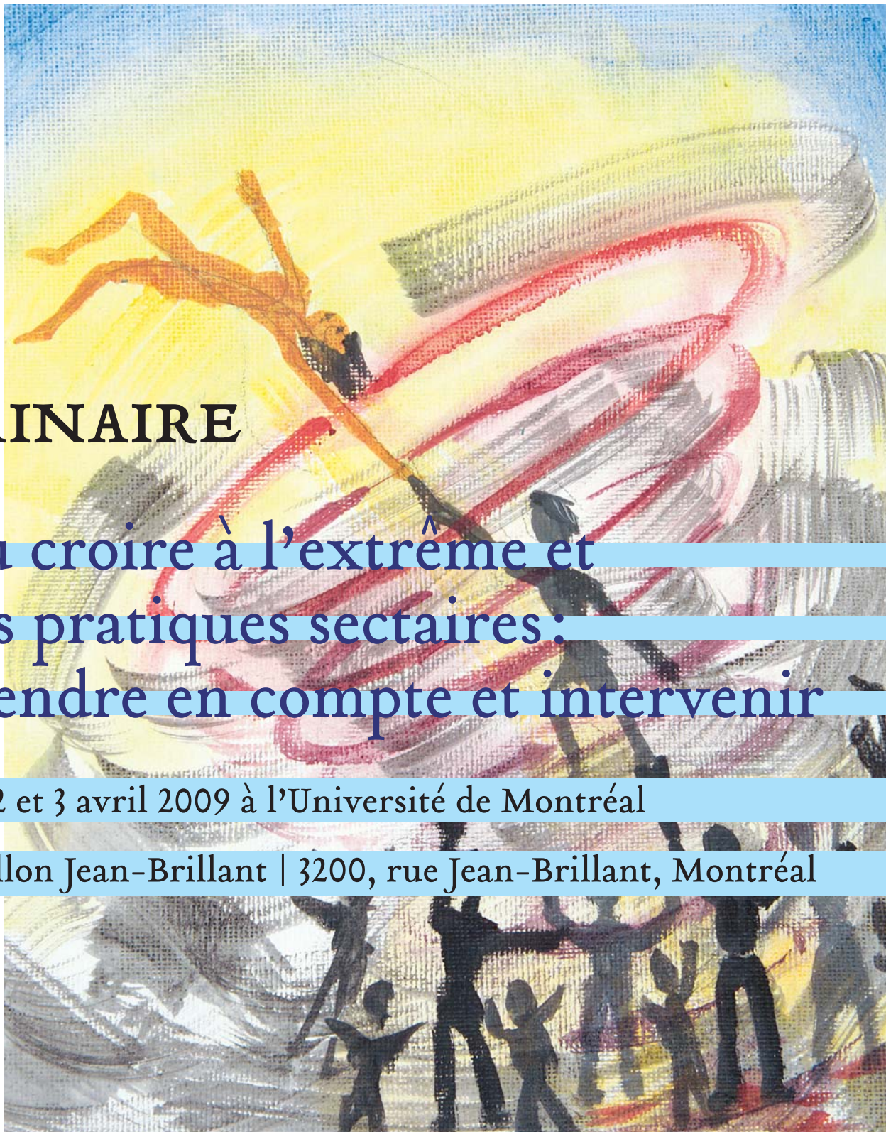
Illustration | Christine Cole

Pavillon Jean-Brillant | 3200, rue Jean-Brillant, Montréal