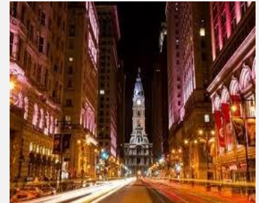
Philadelphie, site du Congrès de l'ICSA 2018