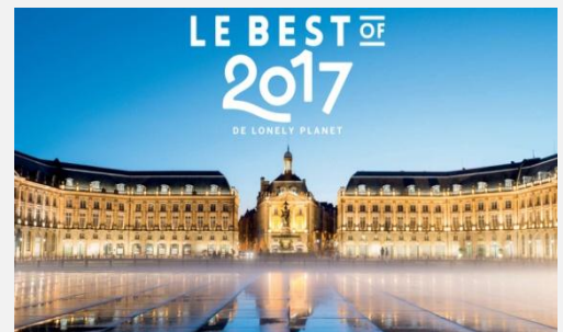
Bordeaux, France Site du Congrès international de l'ICSA 2017

Conflicto entre ley secular y ley divina Análisis del discurso de los protestantes conservadores sobre el Estado y la transgresión eventual de la ley 29 september 2016, Universidad Loyola, Acapulco, México 13 october 2016, Universidad del Valle de Cuernavaca, Cuernavaca, México.